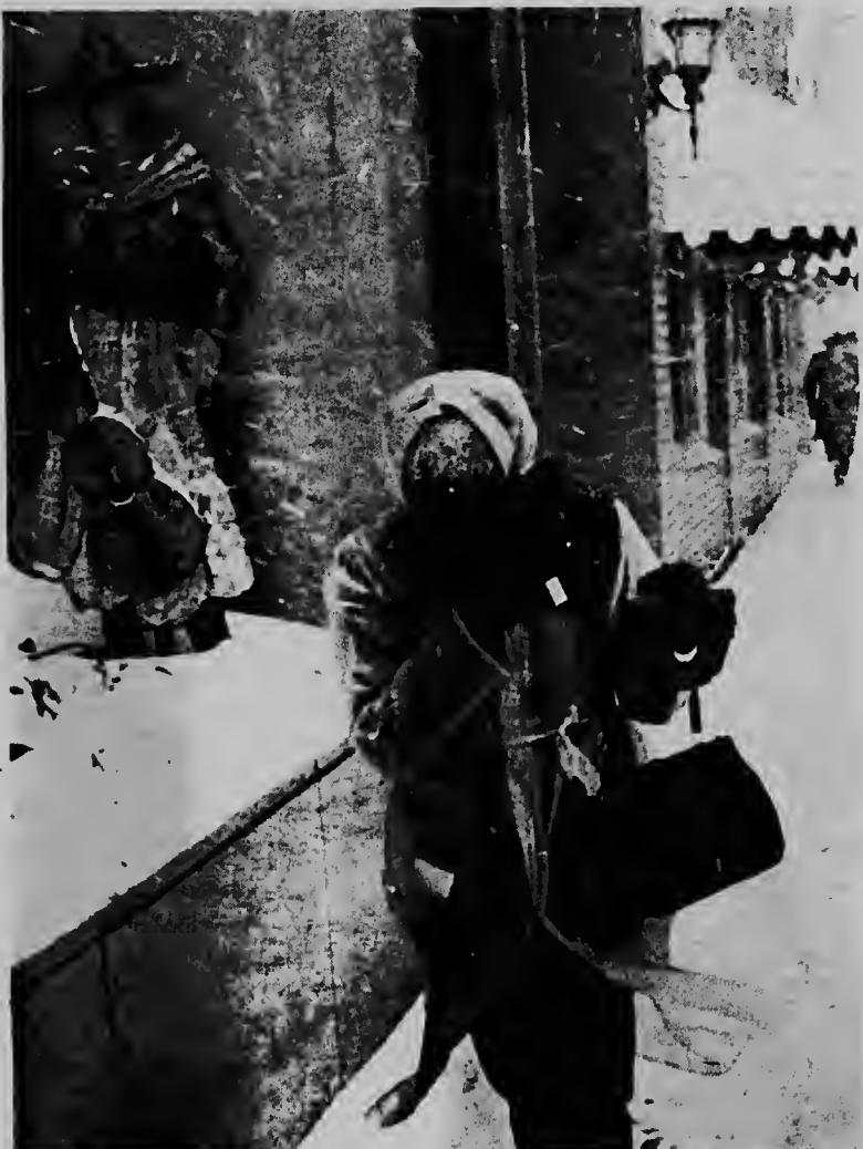
E caballero den showcase no ta sinti e efecto di e tormenta di sneeuw cu pafor di e pacus ta azota e transeuntenan, manera e senjora aki cu ta casi sin por ser reconoce cu ta trata di un dama. — UPI Radiophoto —

timonan aqui ta bisa cu nan companjeronan ta sinti nan intranquilo y cu poliznan ayera den universidad di Barcelona durante dos ora a detene cinco periodista y camarografonan di television. E estudiantenan a bisa cu dia 5 y dia 10 di Maart posiblemente lo nan scohe Sevilla of Pamplona como e luga caminda lo nan sigui discuti publicamente nan exigencianan. E portavoznan no a bisa qui dia lo nan cuminsa trobe cu e curso academico interrumpi na Madrid pa loke autoridadnan universitaria ta califican como di "permanente estado di indisciplina".